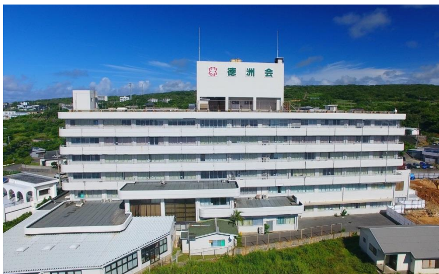
沖永良部徳洲会病院 (鹿児島県大島郡知名町)

中部徳洲会病院は沖縄県の中部地区に所在する347床の中規模病院で、長寿県の中で観光地に近く、また米軍基地に近い商業地として発展した街に所在するため、若年から老年の一般患者に混じって、他府県、外国国籍の受診者もしばしば見受けられる。「救急を断らない」をモットーに年間6,000台以上の救急車を受け入れておりそのほとんどは総合診療部で初期診療を行いその後各科専門科での入院または専門外来へ紹介となりますが、専門科での入院適応ではないが、入院治療が必要な患者すべてを引き受け入院治療を行います。病棟を持つことで救急外来から継続して入院し、退院まで一貫して主治医として治療をおこないます。そして高い病床稼働率の中、ご家庭や地域の医療・介護施設との連携を活発に展開するなかで研修を行います。多くの症例を背景に総合診療専門医を目指す医師に3年間で総合診療専門医を取得して頂くことが可能です。